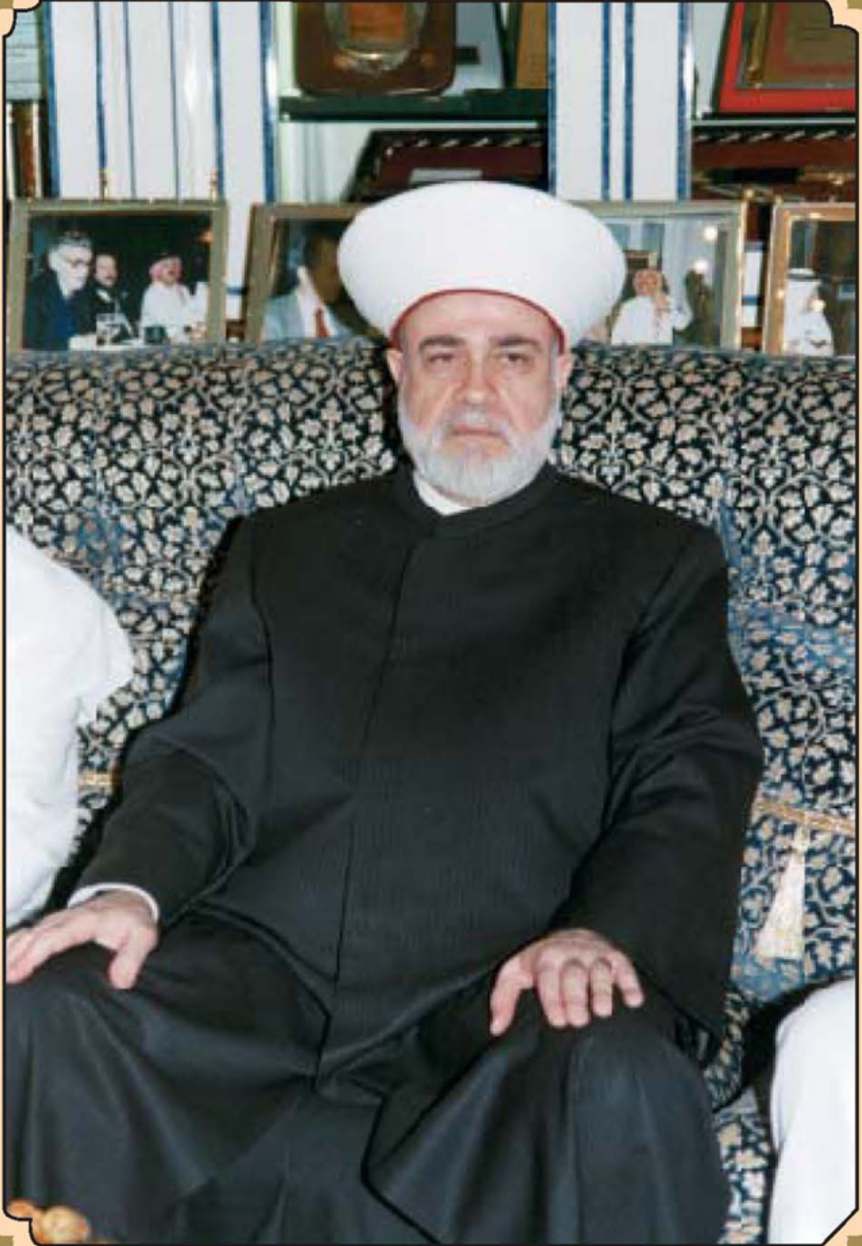
سماحة العلامة الشيخ الدكتور محمد رشيد راغب قباني